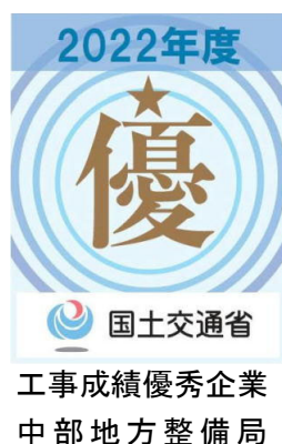
図－1 シール等での使用デザイン

認定企業は、中部地方整備局及び事務所が発注する土木工事（営繕、港湾空港工事は除く）における総合評価落札方式の資格審査の評価項目として加点されます。（詳細は、「工事調達における総合評価落札方式の運用ガイドライン」等による）